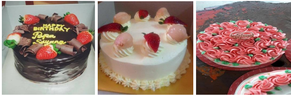
Antara produk yang dijualnya