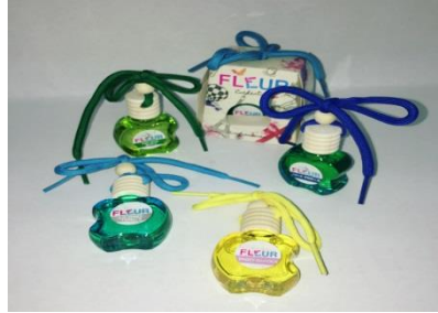
Produk Pewangi kereta yang dijualnya