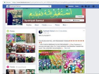
Laman sesawang Facebook yang digunakan peserta untuk mempromosikan perniagaan yang diusahakan