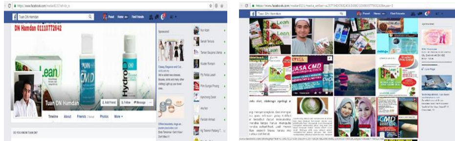
Promosi di laman Facebook beliau.