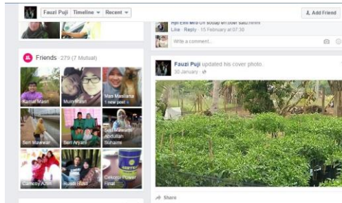
Laman sesawang Facebook yang digunakan peserta untuk mempromosikan perniagaan yang diusahakan