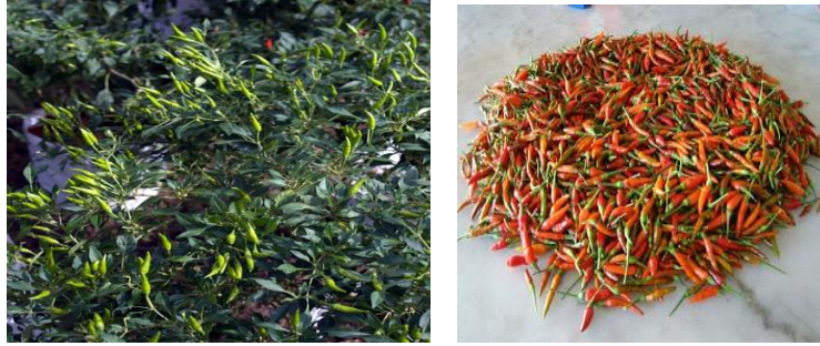
Antara cili api yang telah dipetik